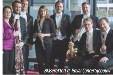
Bläseroktett d. Royal Concertgebouw