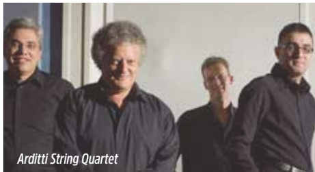
Arditti String Quartet