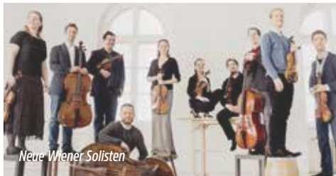
Neue Wiener Solisten