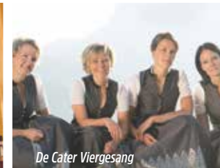
De Cater Viergesang