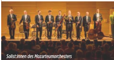
Solist:innen des Mozarteumorchesters